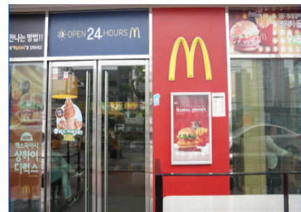
○ 透明系なので店内、特に窓際が良く見えます