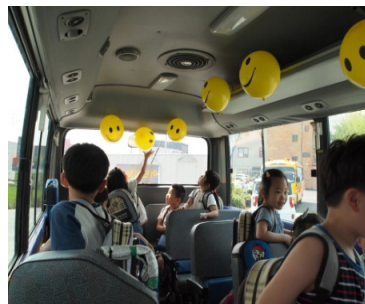
園児送迎バス 紫外線カット+遮熱効果