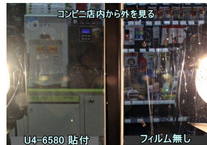
防虫効果もあります。実証実験では86%減！ 虫の走行曲線は380nm～400nmがピークです。