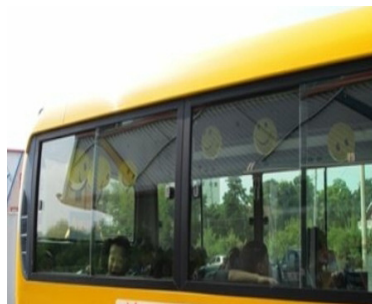
外からも見えやすく安心と高評価